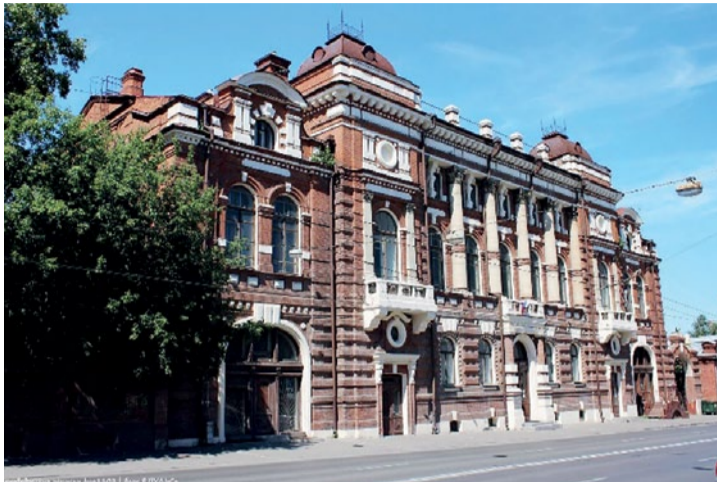
Слева: Томск, Дом общественных собраний (1900) с залом на 1000 мест, памятник архитектуры. Как и большинство зданий К.К. Лыгина, построен без дорогостоящей и недолговечной в условиях Сибири штукатурки. Для цветового оживления фасада применён желтый песчаник. Сооружен на средства томских купцов. До 2011 г. здесь размещался гарнизонный Дом офицеров, в настоящее время находится в собственности мэрии Томска.

В 1893 г. «за отличную, усердную и полезную деятельность по сооружению казарм» Лыгину был пожалован орден св. Станислава III степени. Участвовал он и в различных архитектурных конкурсах. И хотя его проекты побед не одерживали, они получали хвалебные отзывы конкурсных комиссий, а некоторые были удостоены премий.