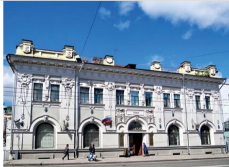
Справа: Томск, Аптекарский магазин «Торгового дома Штоль и Шмитъ» (1906 , ныне Центральная аптека), памятник архитектуры. Гармоничное сочетание больших арочных окон 1-го этажа и небольших окон 2-го, лепной декор лишь украшает фасад, а не довлеет над ним.